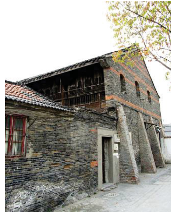
扬州教案旧址： 广陵区皮市街147~149号

同年11月，戴德生和家人回到扬州故居，他一家和其他传教士在逼迫中对神完全的信靠、对人的忍耐和爱心赢得扬州人的心。因着他们的见证，那位在戴德生初到扬州时接待他们一家的客店老板，还有两个在暴乱中仍敢对他们表达同情的当地人，都先后信主受洗。 52