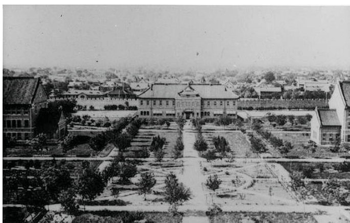
1940 年的齐鲁大学校园 （左：柏根楼；中：办公楼；右：考文楼）

另外，教会学校也培育了不少教会领袖和社会人材，有传教助手、教师、医生等等。举例说，由狄考文在山东设立的文会馆（后来的 齐鲁大学 ）既教授中国古典经籍，鼓励学生参加科举晋升官场，又教授西方近代科学知识；因此能成功建立学校在中国社会的地位。结果，后来北京国立教育机构同文馆的科学教师，几乎都是文会馆的毕业生。据统计，文会馆有超过半数的毕业生分别在教会和国立学校任教，而成为教会牧者的，则包括丁立美和贾玉铭。