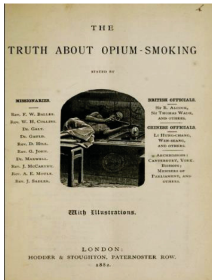
英文册子《吸食鸦片的真相》

1874年，一群英国基督徒，在英国成立英华禁止鸦片贸易协会，推行禁烟运动，出版刊物《中国之友》，上书政府。英国下议院为此展开一连串的辩论。