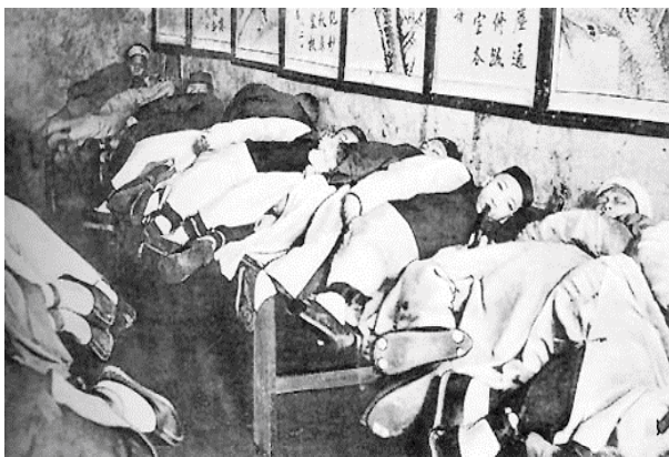
平民烟馆，卧满了吸食鸦片的人

一位山西省隰(音习)州传教站的传教士在 1897 年指出，宣教区内大多数家庭都有鸦片烟和烟枪，一家中成人、小孩多人吸食，有些母亲甚至在吸食时与婴儿亲咀，把烟瘾传给婴孩。 12