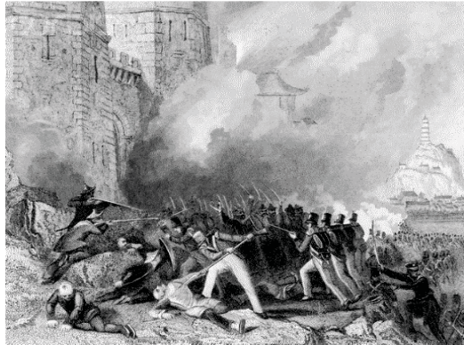
第一次鸦片战争，英军攻占镇江

清廷轻视英国，认为英国只是为了通商图利才派军舰前来，只要天朝示以兵威，夷人必然就范。然而，事实是中国在科技和军事上，大大落后于西方。自从1720年康熙下令禁教后，传教士无法继续将西方的科技和知识引入中国；清廷又自视为泱泱大国，一直闭关自守，令中国跟世界严重脱节。加上禁教后的一百年，西方展开工业革命，科技突飞猛进，清军根本无力抵挡英军的坚船利炮，结果战败求和，正是“骄傲来，羞耻也来”（箴 11:2）。